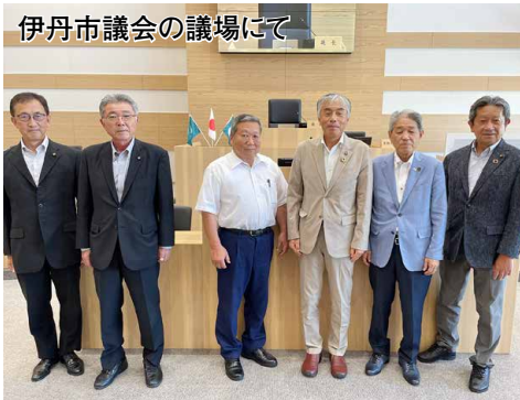
伊丹市議会の議場にて

伊丹市は犯罪が多かったことから、防犯カメラを1小学校区あたり50台を目安に1,000台設置した。カメラにはビーコンによる見守り機能も持たせる。これにより犯罪認知件数が減少し、犯罪抑止に効果を上げていた点が参考になった。