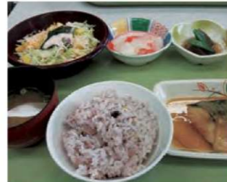
元氣じゃけん定食(広島市)