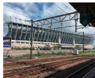
ベストアメニティスタジアム(鳥栖市)

豊田市議会自民クラブ議員団 広報委員会 発行日 2017年1月1日 www.toyota-jimin.jp