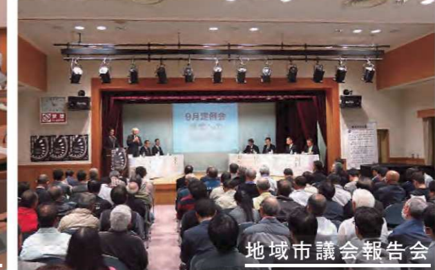
地域市議会報告会