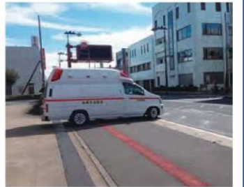
ドクターカー(前橋市)

参考と なった点 ドクターカーは、ドクターヘリが日没や天候不良などで飛ばないときのドクターヘリ補完事業として開始された。ドクターカーは、直接事故現場まで入ることができるため、通常救急搬送した場合より、早く医療介入が出来る。今年度は専用ホットラインを導入し、半年間で昨年 3.5 倍の要請件数と大幅な時間短縮を実現している。