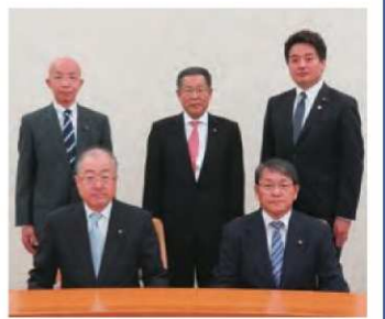
教育次世代部会員

参考と なった点 行政職員を各学校に2名配置し、自治会改革や教育委員会改革にも取り組み、地域住民の積極的な参加をしている。成果についても、子どもたちの基本的な生活習慣が確立されるなど、多くの成果を挙げている。今後の本市のコミュニティ・スクール施策に大いに参考になった。