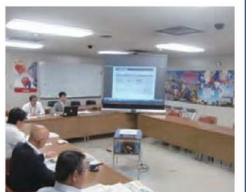
待機児童対策(佐賀市)

参考と なった点 スポーツコミッションを設立し、大会・合宿誘致から人材育成やスポーツツーリズムまで、幅広く県内のスポーツのワンストップ窓口が整備された。また大会誘致から人材育成まで地元のプロサッカークラブと連携して行うスポーツコミッションは、現在検討している本市のスポーツコミッションの参考になる。