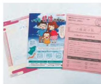
縁結び定住施策(出雲市)