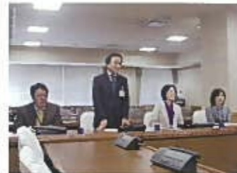
歯と口腔健康づくり条例の説明

会派相互や議会と行政の調整、また歯科医師会と歯科衛生士会との協議、パブリックコメントなど2年かけて検討が十分に行われての条例制定であること、また歯科医師が関係部局にいること。