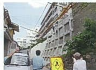
ガケ地防災工事視察

金沢市の市街地は、起伏が多くガケ地を背負う住宅が多く存在しており、過去の風水害で多くの住宅が被災したため、ガケ地(斜面30度以上、高さ3m以上)を背負う住宅地権者が防災工事を行う場合の補助制度を設けている。