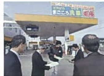
サンカーデン吉備路

民間企業の障がい者雇用促進のために、優先調達を条例に明文化していること、地元の理解や支援・協力が進んでいること、さらには市長が自ら事あるごとにあいさつ等の中で話題として啓発していることなどの取組。