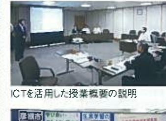
ICTを活用した授業概要の説明