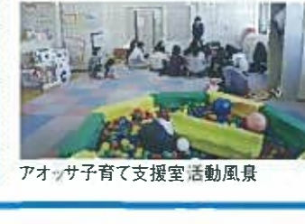
アオッサ子育て支援室活動風景

視察概要 ◆子育て支援室・相談室の事業の概要 ◆子育て支援室・相談室の取組みの経緯・状況 ◆現在の課題と今後の課題 参考となった点 平成19年アオッサ子ども家庭センター(子育て支援室・相談室)を立地条件の良い福井駅前開所。アオッサ子ども家庭支援センターを福井(愛学園(大学)へ運営委託とする極めて珍しい形態を導入。福井市内でアオッサのみ土・日・祝オープンし児童の利用多い。又、児童相談機能体制も充実した。市内の小中学校区に「地域子育て支援委員会」を設置し地域支援活動として運営等の連携実施。