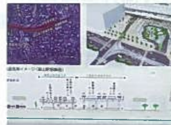
富山駅周辺整備事業

北陸新幹線の開通に合わせ、富山駅の高架化事業が進められ、駅前・駅裏市街地の一体化が図られ、駅周辺商店街の集客が見込まれる。また自転車の共同利用は、市内15か所にステーションが設置され200台が市民や観光客の移動手段として利用されている。