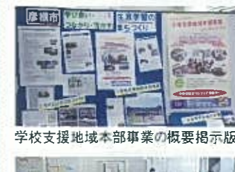
学校支援地域本部事業の概要掲示板

視察概要 ◆学校支援地域本部事業の概要 ◆学校支援地域本部事業の取組みの経緯・状況 ◆現在の課題と今後の課題 参考となった点 平成19年滋賀県の「地域の教育力向上」活動推進事業に「学校支援地域本部」が検討開始。平成20年文部科学省委託事業予算化と同時に「学校支援地域本部実行委員会設置要綱」作成。平成23年より市の委託事業として市内全中学校区へ拡大実施。学校と地域の一体感向上の成果有。平成25年は市の重点事業として捉える中、2校区においていじめ対応をテーマとするなど幅広く活動開始。