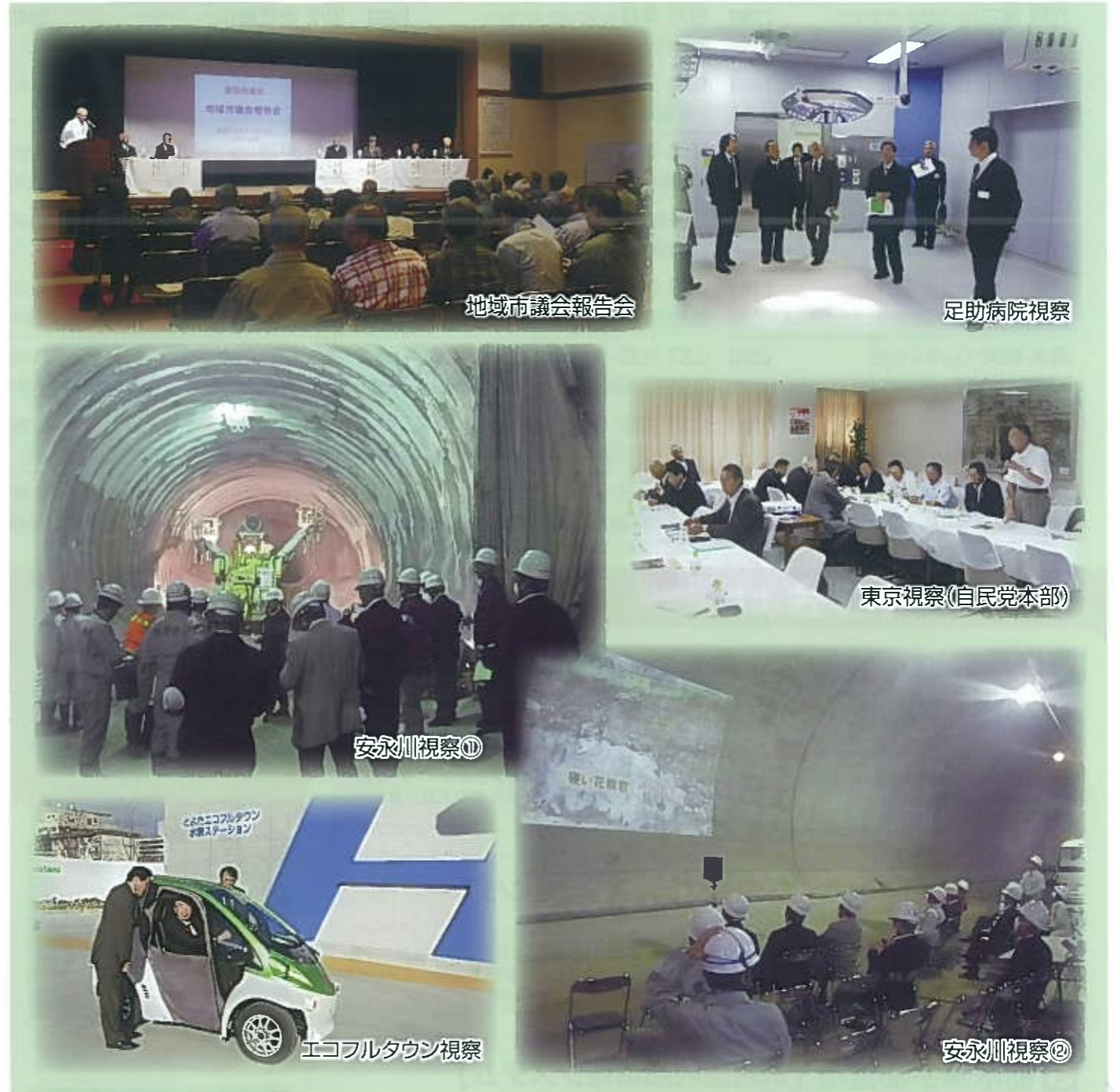
地域市議会報告会